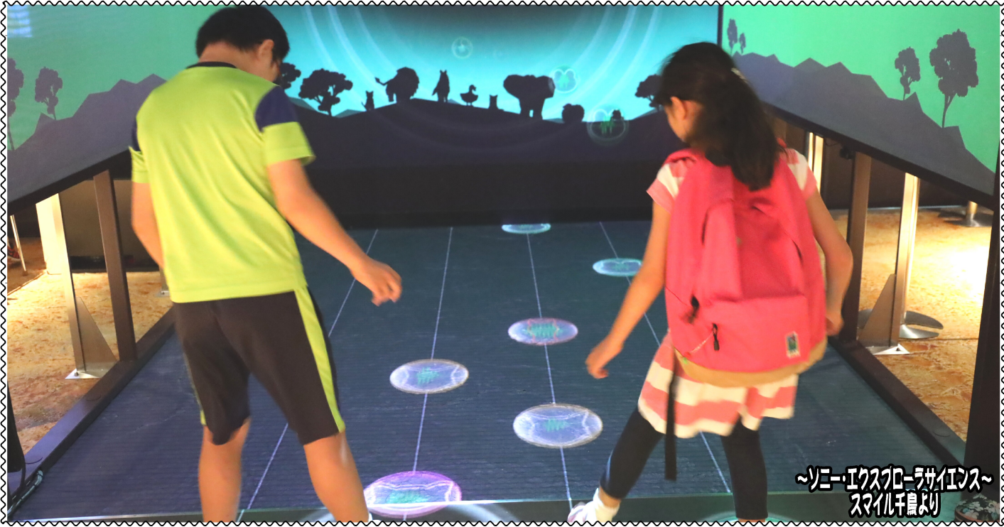
～ソニー・エクスプローラサイエンス～ スマイル千鳥より

発行：株式会社スマイルキッズ 通信編集委員会 住所：東京都大田区南久が原2-12-14 三立ビル1F 電話：03-6715-2370 ■ 発達支援教室スマイル千鳥 ■ 発達支援教室スマイル久が原 ■ 発達支援教室スマイル久が原プラス ■ 移動支援事業所スマイルアクティブ